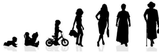
Frauen- und Müttergemeinschaft Jonschwil - Schwarzenbach